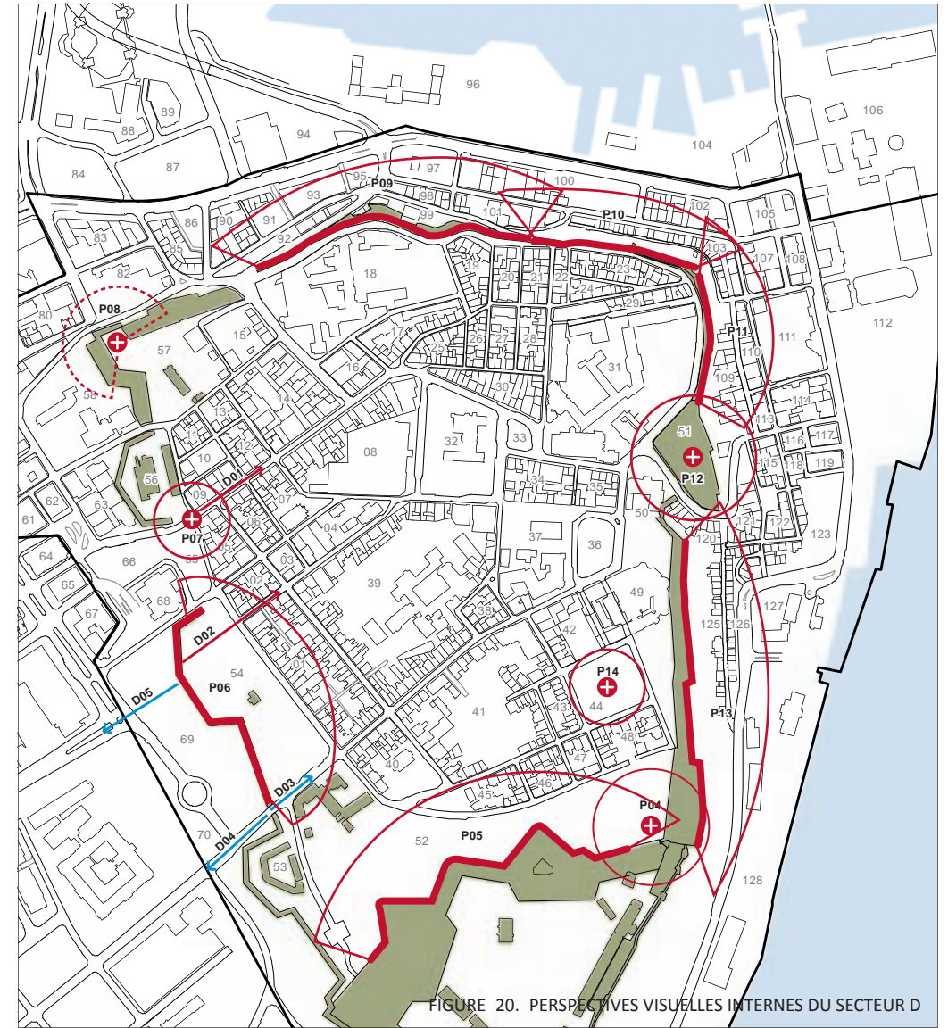
FIGURE 20. PERSPECTIVES VISUELLES INTERNES DU SECTEUR D